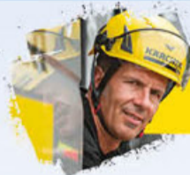
Klaus DAUVEN Artiste

2021 SERA MARQUÉE PAR LA RÉALISATION D'UNE ŒUVRE MONUMENTALE ÉPHÉMÈRE SUR LE BARRAGE DE VOUGLANS. IMAGINÉE PAR L'ARTISTE KLAUS DAUVEN ET RÉALISÉE PAR LES ÉQUIPES KÄRCHER, ELLE A NÉCESSITÉ UNE COLLABORATION INÉDITE ENTRE 2 GROUPES INDUSTRIELS RÉPUTÉS... UNE EXPÉRIENCE HORS NORME POUR UN RÉSULTAT FANTASTIQUE !